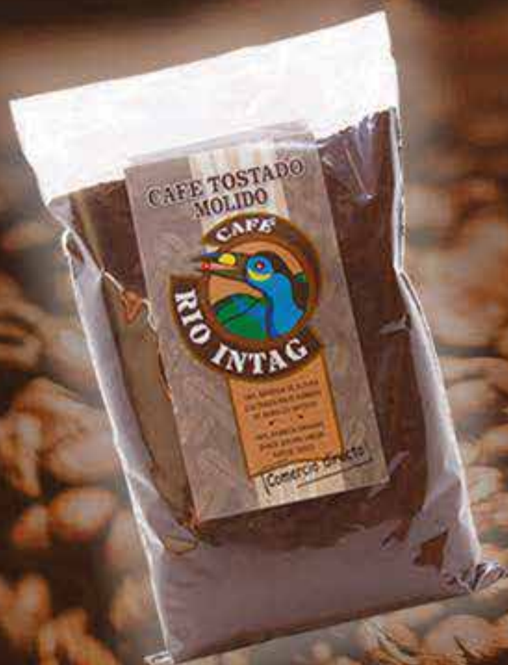
Café tostado molido 1000 g

NUEVOS EMPAQUES DISPENSADORES DE FUNDITAS DE 30 G