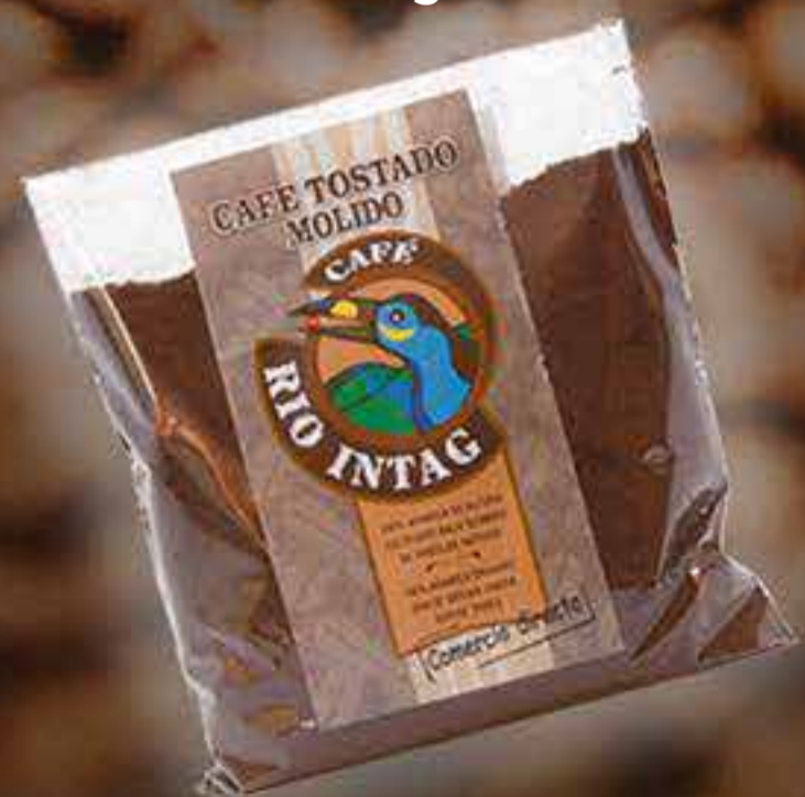
Café tostado molido 250 g