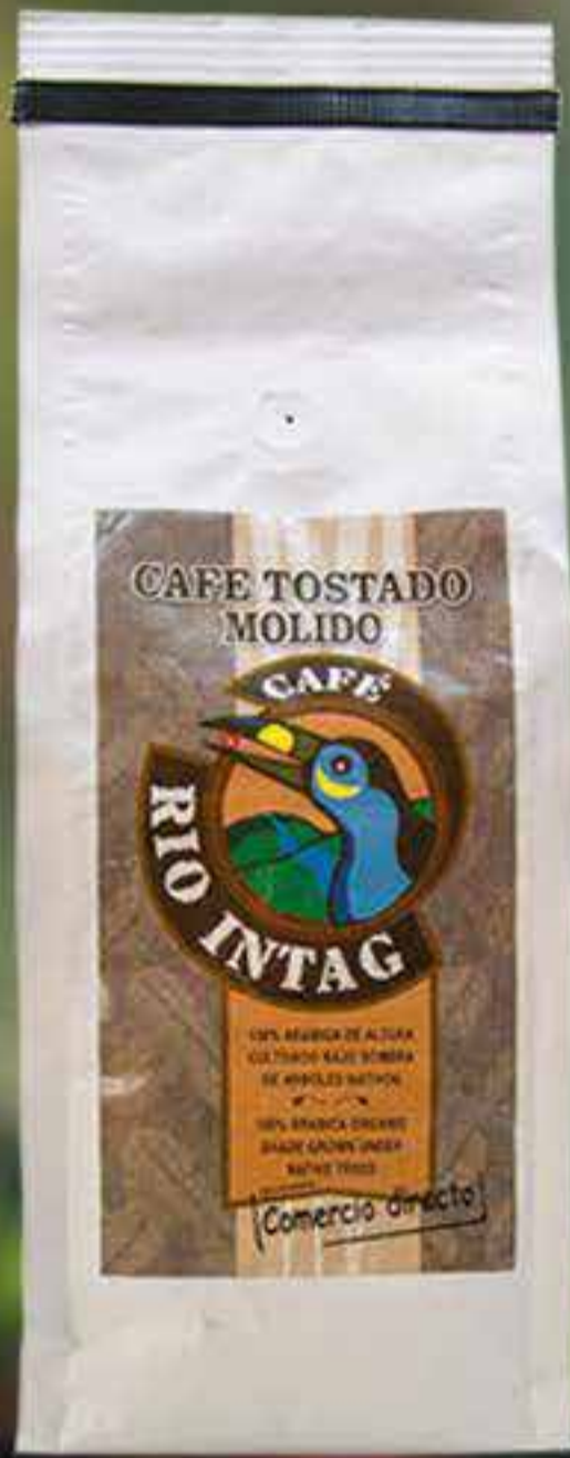
Café tostado molido 500 g