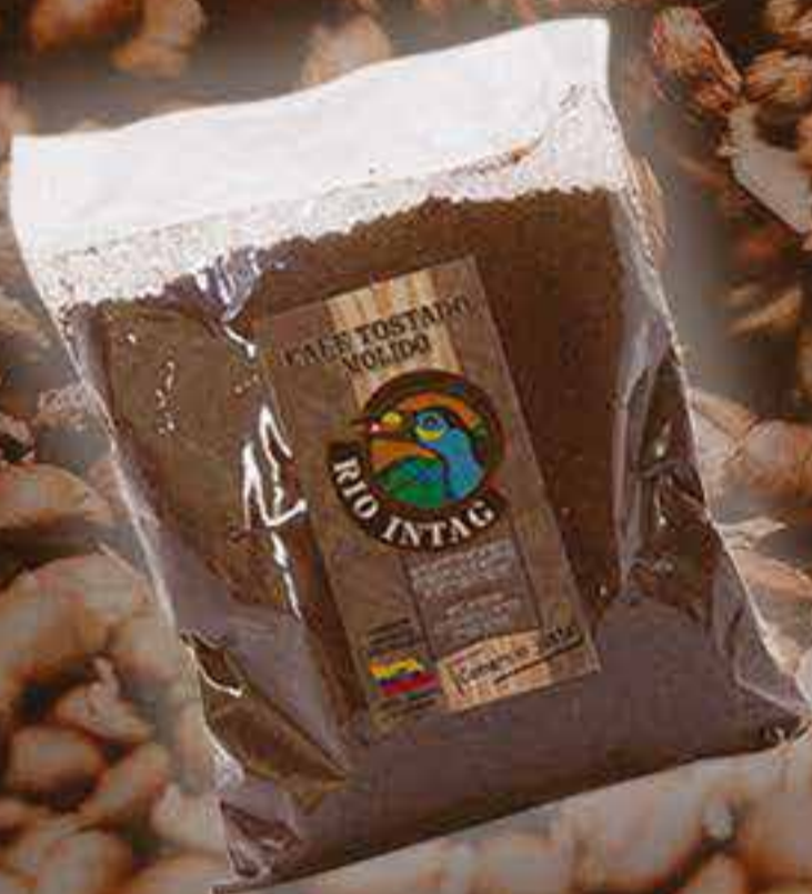
Café tostado molido 500 g