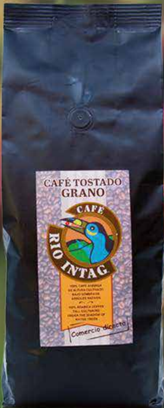
Café tostado en grano 1 kilo